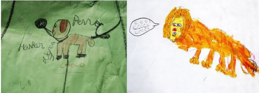
Figura 3. Representaciones plásticas de las emociones identificadas